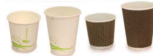
120 ml 240 ml 120 ml 240 ml 1 pared 2 paredes