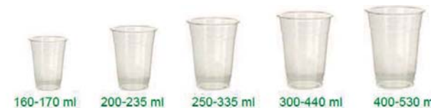
160-170 ml 200-235 ml 250-335 ml 300-440 ml 400-530 ml