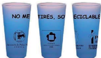
CAPACIDAD VASOS REUTILIZABLES