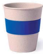
NL 76012 38 cl.