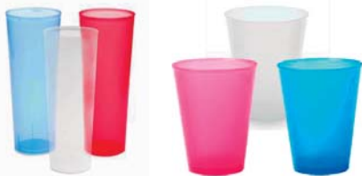
NL 72493 30 cl.