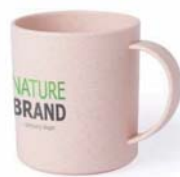
NL 76152 35 cl.

Colores translucidos: rojo, azul y transparente.