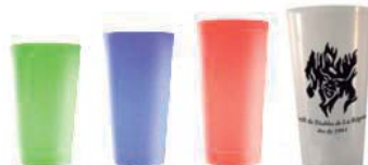
Pequeño 12 cl. Clásico 30 cl. Medium 40 cl. Extra 60 cl.